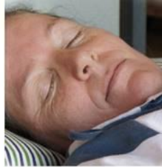
Parkinson patiënten slapen beter met dopamine vrijgave bevorderende oliën